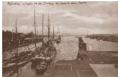
Schleuse Holtenau Blick zur Kieler Förde

Öffnungszeiten der Sonder- und Dauerausstellung: vom 30. Juni bis 6. Oktober 2021 mittwochs: 15:00 bis 18:00 Uhr sonntags: 12:00 bis 16:00 Uhr